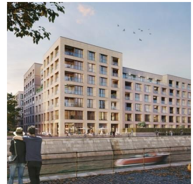
Wiener Etagen Berlin-Moabit (Europacity)