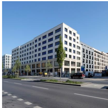
Prager Karree Berlin-Moabit (Europacity)