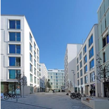
Puhmannhof Berlin-Prenzlauer Berg