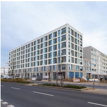
Budapester Höfe Berlin-Moabit (Europacity)