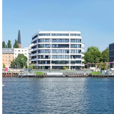
The White Berlin-Friedrichshain